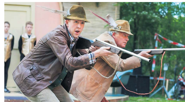
Stipe.frl wil de mienskip ondersteunen in het opzetten van culturele activiteiten.

„Alle vragen die gesteld worden als er een projectplan wordt ingediend, hebben we verzameld en samengevat“, zegt Baarsma. „Aan de hand van een checklist kunnen de plannenmakers van bijvoorbeeld een gelegenheidsiepenlofspan nu con-